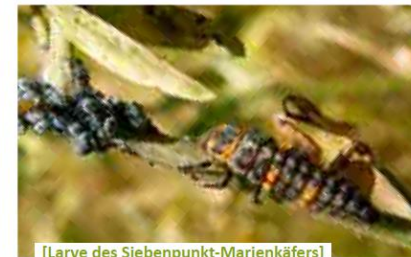
[Larve des Siebenpunkt-Marienkäfers]